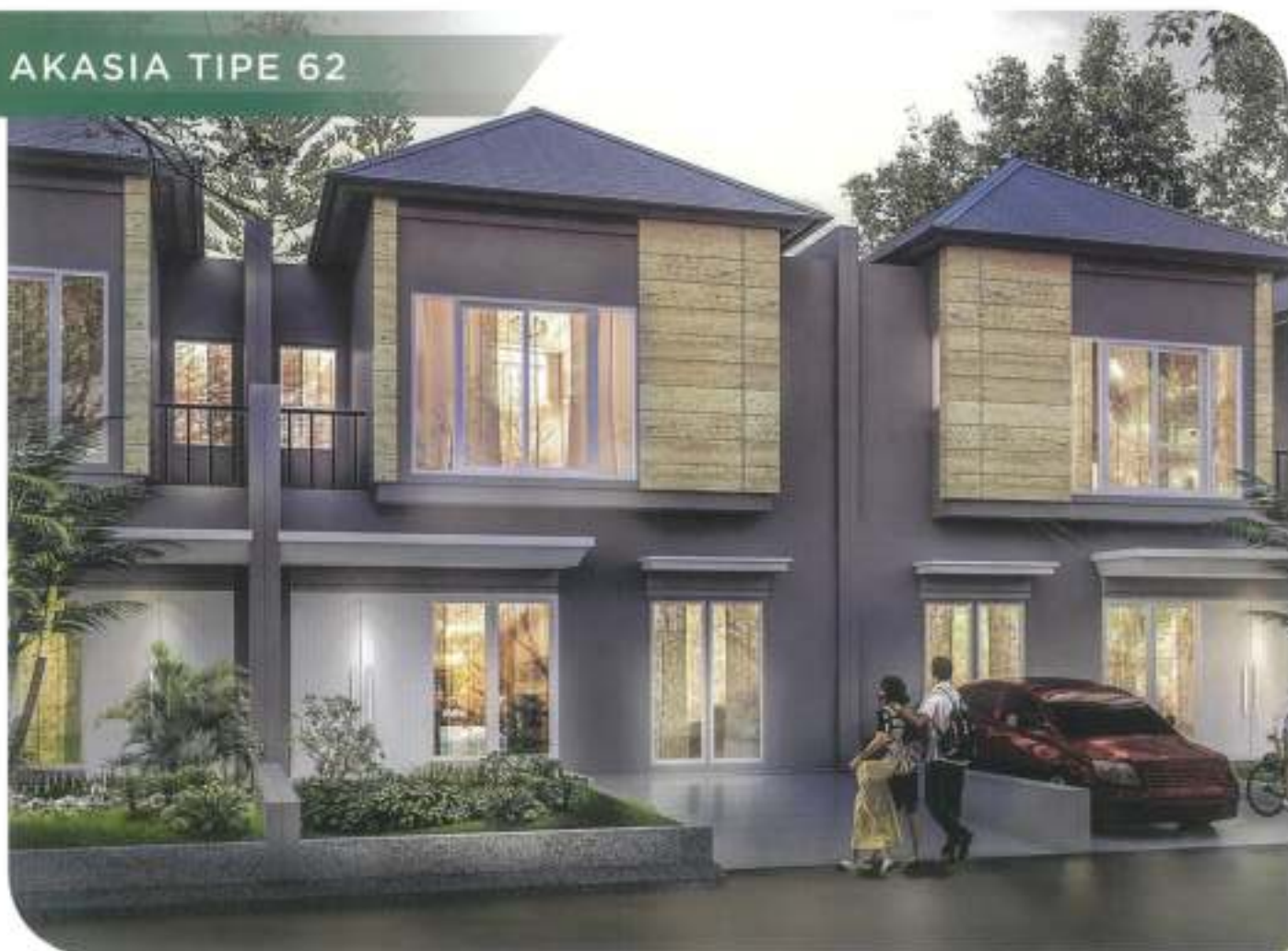
AKASIA TIPE 62 LB/LT 62 m 2 /112 m 2