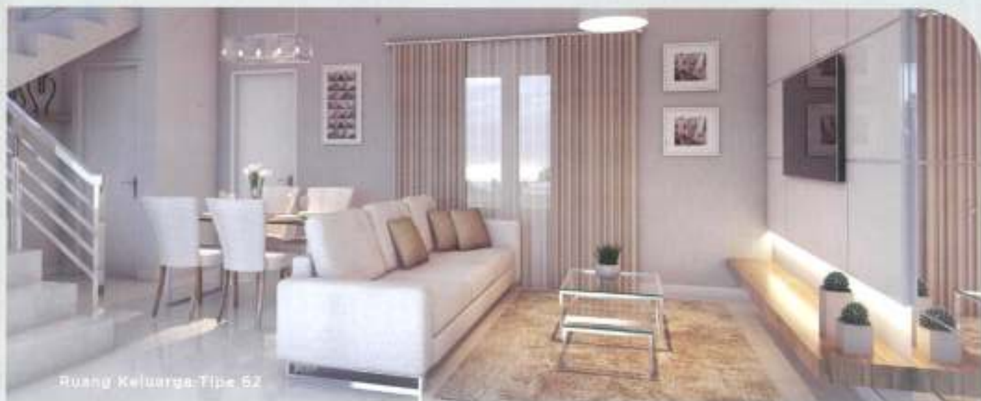
Ruang Keluarga Tipe 52