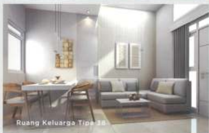
Ruang Keluarga Tipe 38