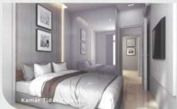
Kamar Tidur Tipe 49